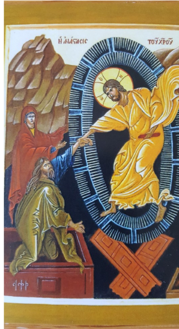
Ikone v. Pfr.O.Schmid

„Am ersten Tag der Woche kam Maria von Magdala frühmorgens, als es noch dunkel war, zum Grab und sah, dass der Stein vom Grab weggenommen war.“ Joh 20,1)